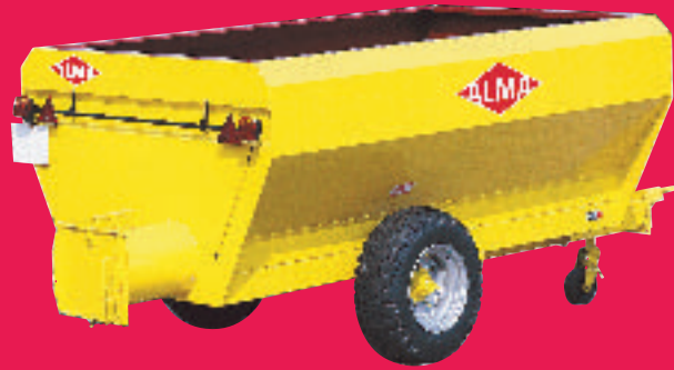
Tombereau autovidant sortie libre standard