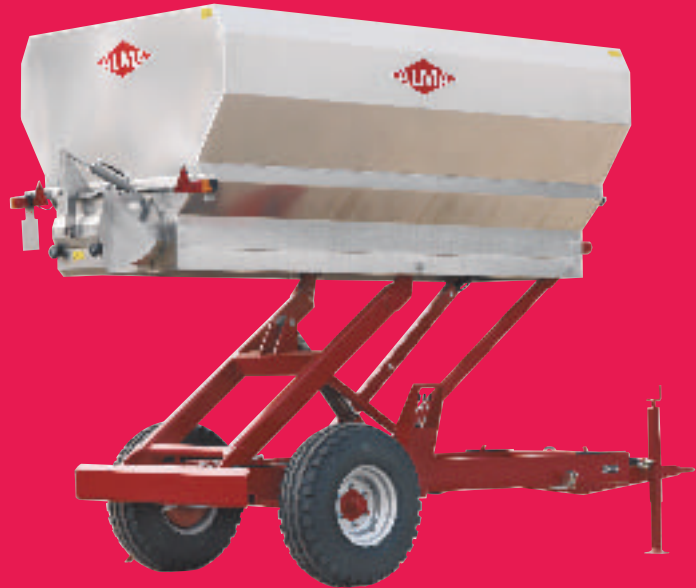
Tombereau autovidant sortie libre élévateur